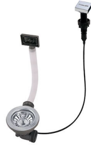
Automatischer Abfluss LIRA 8407 102