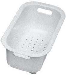
Weißes Nudelsieb 8151 100