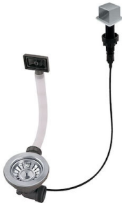
Automatischer Abfluss LIRA 8407 103