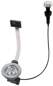
Automatischer Abfluss 8407 100