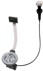
Automatischer Abfluss 8407 000